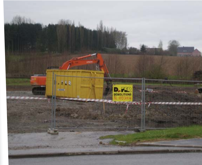
Avril 2009 : travaux de requalification du site