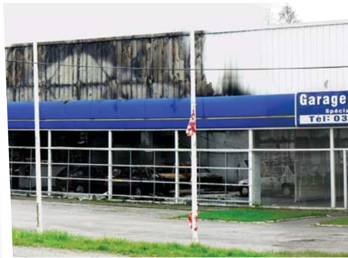
Décembre 2006 : le garage incendié

Ce partenariat permet que l'EPF fasse l'acquisition d'un site pour le compte de notre intercommunalité, tout en réalisant les travaux de désamiantage et de démolition des bâtiments qui ne seront pas conservés, et en assurant les travaux nécessaires à la préservation de ceux maintenus dans l'attente de la définition du projet final.